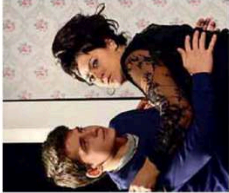
Premiata la Filodrammatica

Vinto il primo premio alla rassegna teatrale di Mezzolombardo