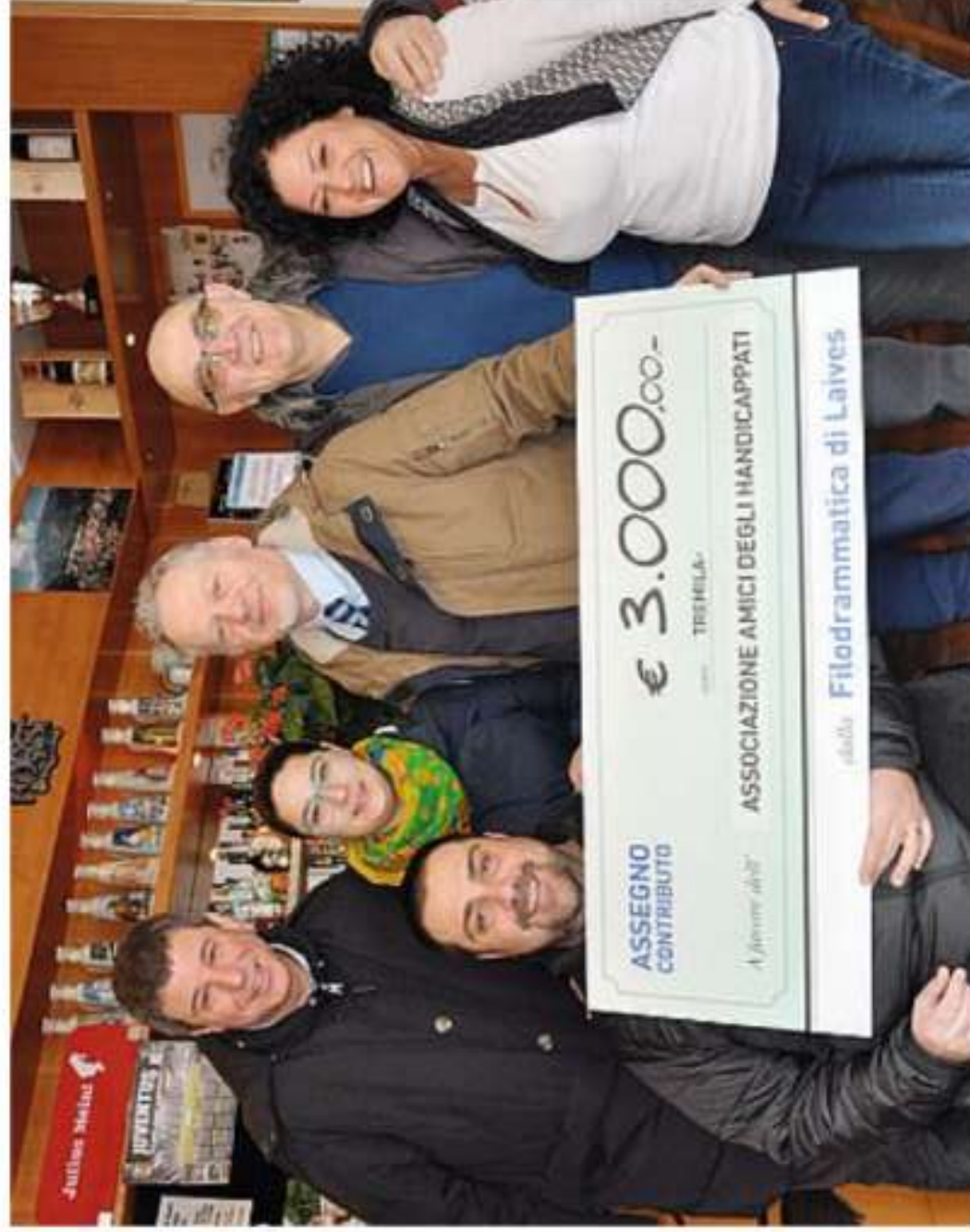
La consegna dell'assegno da 3 mila euro