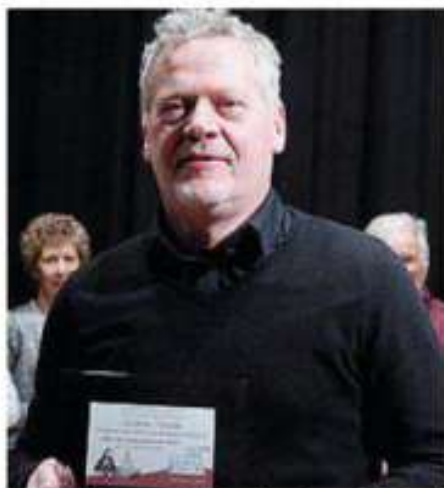
Il presidente della Filo