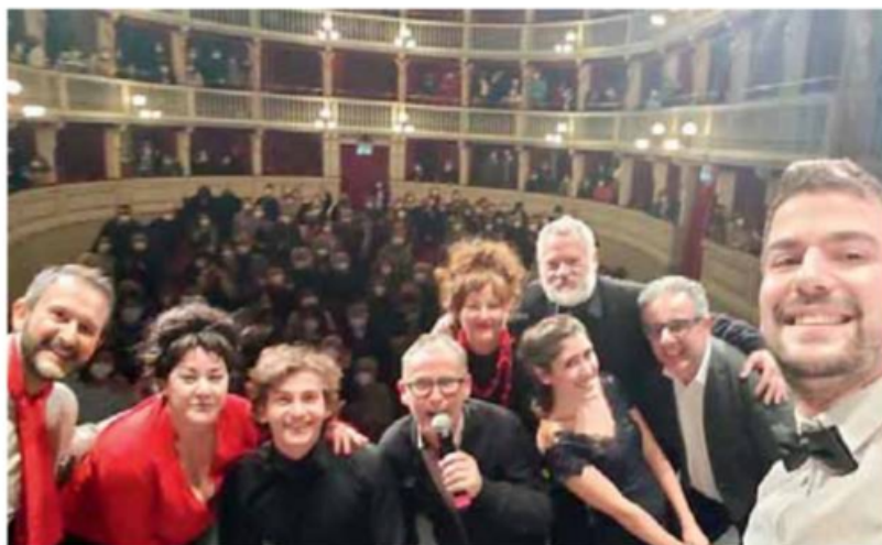
• La Filodrammatica di Laives in trasferta ad Altamura

LAVES. Lo splendido teatro "Mercadante" di Altamura (Puglia) ha fatto da cornice alla commedia "Il marito di mio figlio", uno dei lavori di maggior successo portato in scena a più riprese dalla Filodrammatica di Laives, con la regia di Roby De Tomas. Si tratta di una moderna commedia degli equivoci che affronta un tema molto attuale, quello dell'amore fra persone dello stesso sesso e lo fa senza alcuna retorica, seguendo le vicende di una coppia di ragazzi che si amano e hanno deciso di convivere.