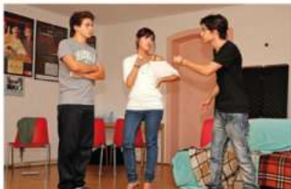
I giovani attori alle prese con la commedia degli equivoci