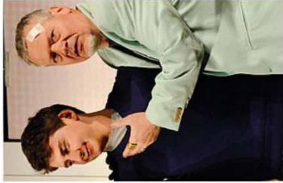
La Filodrammatica in una scena

Importante partecipazione alla rassegna teatrale al Cristallo