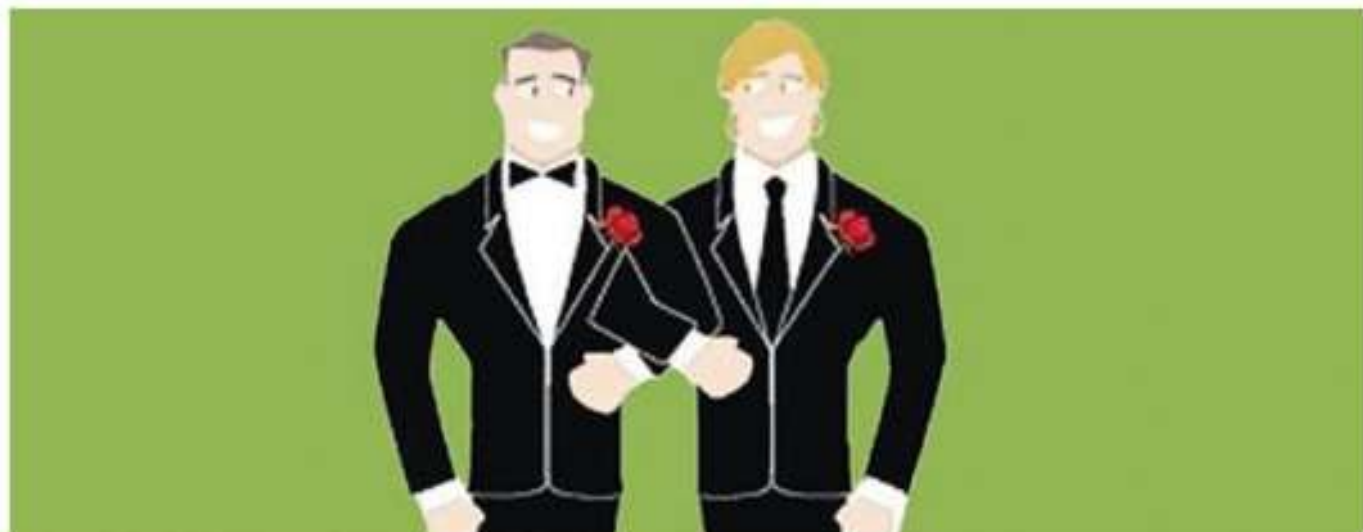
La locandina dello spettacolo teatrale al Cristallo