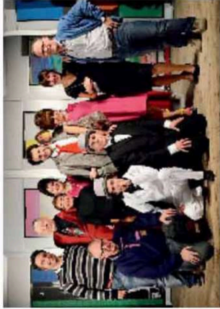
Ancora premi prestigiosi per la Filodrammatica di Laives