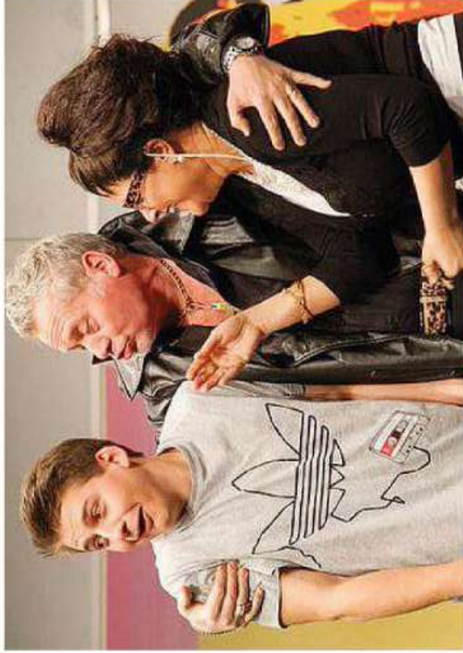
La Filodrammatica di Laives porterà in scena "Il marito di mio figlio"