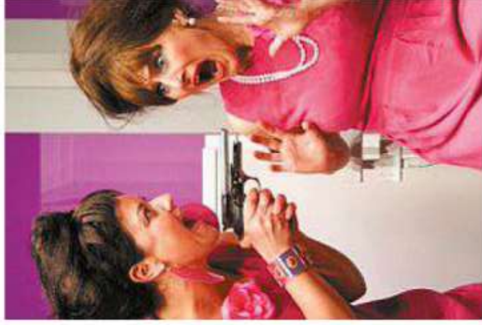
La filodrammatica di Laives

ma battute folgoranti, situazioni comiche e personaggi realmente improbabili. Nessuna propaganda, nessuna bandiera gay o anti gay da avvalorare, ma brillantemente in primo piano un tentativo di convivenza di una coppia di ragazzi che si amano e che forti della loro gioventù non vogliono farsi condizionare dalle convenzioni dei grandi». Anche per i non abbonati, biglietti si trovano presso la Filodrammatica o al negozio Fiori Berger di via Kennedy a Laives oltre che al botteghino del teatro venerdì sera. (b.c.)