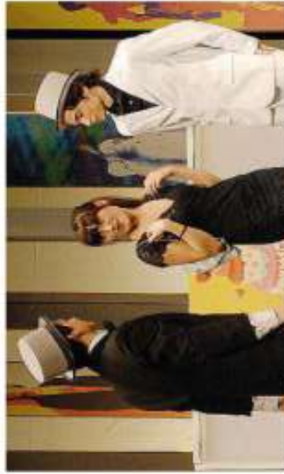
La compagnia stasera in scena alla Casa della cultura di Bronzolo