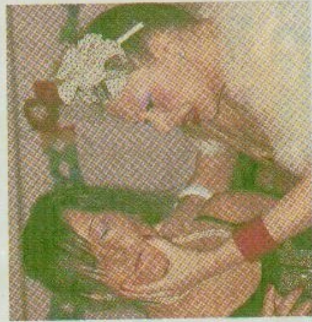
A destra, due attrici durante la "commedia" al ristorante e più a lato una tavolata